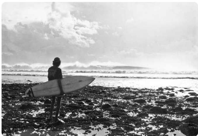
Grajagan, Java, 1979