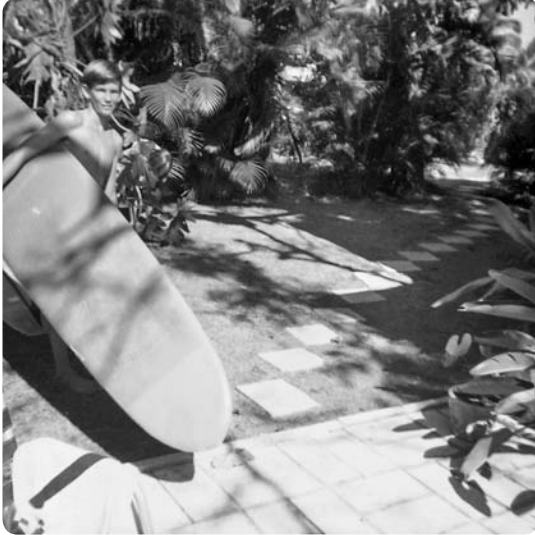
Der Weg zum Wasser vom Haus an der Kulamanu, 1966

paradoxe Weise, die ich damals noch nicht recht zu schätzen wusste, stündlich zum gewaltsamen Gegenbeweis jeglicher Verlässlichkeit steigerten. Cliffs war auf eine Weise launisch und komplex, wie ich es noch nie erlebt hatte.