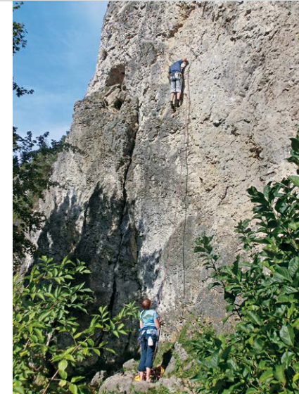
Die Kletterfelsen sind sehr beliebt.