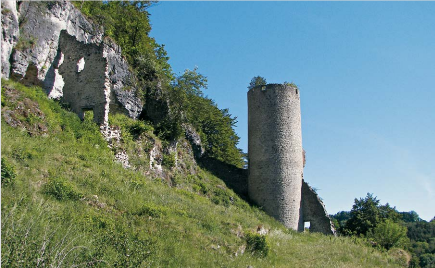
Der Bergfried der Ruine Loch – bewohnt waren die mit Holz verschalteten Höhlen im Fels.

links und führt in den Wald. Das blaue Dreieck stößt von Nittendorf kommend hinzu und übernimmt die Wegführung nach Eichhofen (6) . Ein hübscher eingewachsener Waldpfad leitet uns hinab in den Ort. Zur Gaststätte der Schlossbrauerei Eichhofen gelangen wir über die Labertalstraße nach rechts und vor Haus Nr. 20 links über einen Steg.