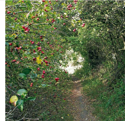
Der grün umrankte Katzenpfotenweg.

unmarkiert links, bis wir auf das blaue Rechteck stoßen. Mit diesem nach rechts in den Wald und ein Stück auf dem vom Hinweg bekannten Weg zurück. Mit bereits erwähntem blauem Dreieck biegen wir links in Richtung Nittendorf ab. Knapp 10 Min. später erreichen wir eine Lichtung. Hier verlassen wir die Markierung und steigen am rechten Waldrand entlang den Hang hinab. Das letzte Stück können wir auf einem Pfad im Wald zurücklegen. An der Waldecke geradeaus den Feldweg, dann das Sträßchen nach Schönhofen hinab. Auf der Nittendorfer Straße rechts und den Feldweg vor Haus Nr. 40 a links, an den bunten Häusern vorbei, bergan. Am Querweg rechts und den von Bäumen gesäumten Pfad entlang. Rotes Rechteck und Jurasteig kommen hinzu, und kurz darauf biegen wir links in den »Katzenpfotenweg« ab. Wie durch einen grünen Tunnel aus Bäumen und Büschen steigt der mit einer Katzenpfote markierte Pfad hinauf zum Alpinen Steig. Nun können wir rechts für eine Rast zum Naturfreundehaus (3) abbiegen oder nach links unseren Rückweg antreten. Diesmal wählen wir den Höhenweg des Unteren Alpinen Steigs und gelangen mit der Markierung blaues Rechteck zurück nach Eilsbrunn (1) , wo uns der Biergarten des Gasthofs Röhl empfängt.