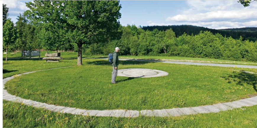
Der Mittelpunkt Mitteleuropas in einer Grünanlage mit Infotafeln bei Hildweinsreuth.

In Konradsreuth (1) folgen wir gegenüber der Bushaltestelle dem roten Rechteck auf einem Feldweg auf den Wald zu. An der Gabelung am Waldrand halten wir uns mit der Markierung links und wandern auf gut markierten Waldwegen leicht bergan. Nach einem kurzen Abschnitt auf Forstweg steigt der Weg immer steiler hinauf zum Gipfel des Haselstein (2) . Am Beginn des Gipfels entdecken wir einen versteinerten Wachhund. Durch ein steinernes Tor und über in den Fels gehauene Steinstufen erklimmen wir die