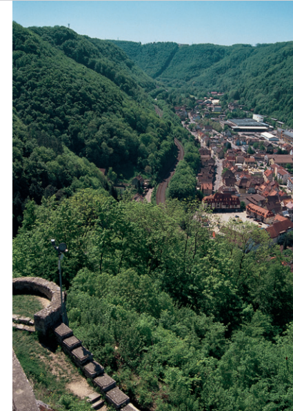
Geislingen an der Steige vom Aussichtsturm der Ruine Helfenstein.