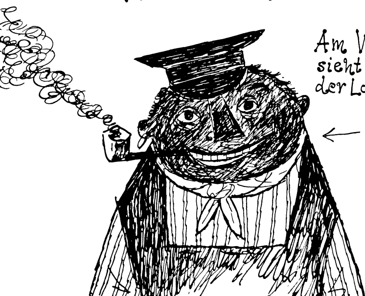
Am Werktag aber sieht Lukas der Lokomotivführer