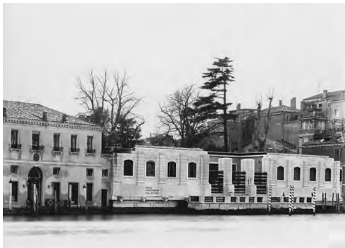
2 Der Palazzo Venier dei Leoni Ende des 20. Jahrhunderts. Er beherbergt heute die Peggy Guggenheim Collection.