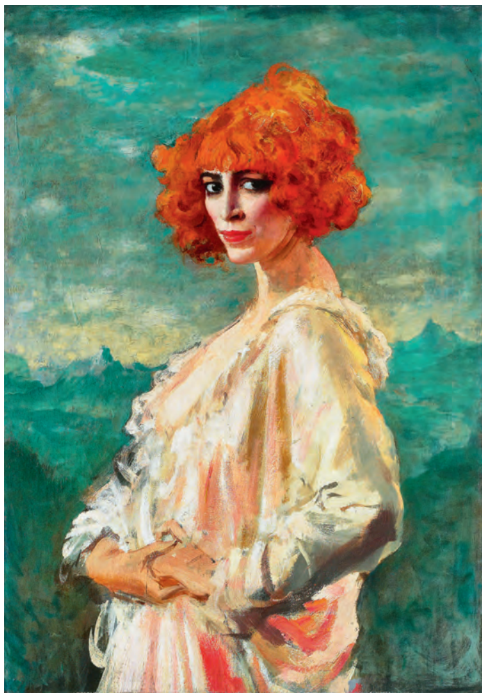
1 Luisa Casati, gemalt von Augustus John (1919).