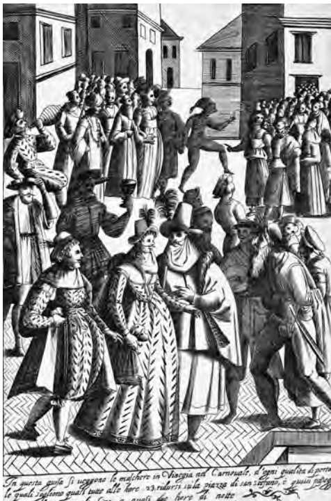
5 Karneval im Venedig des 17. Jahrhunderts.

te hatte Venedig vor allem Dichter und Künstler angelockt, denn die Stadt versprach ein Entkommen aus der Eintönigkeit und den Zwängen des normalen Lebens. Als Byron sich 1816 dort niederließ, begrüßte er die Stadt als »die grünste Insel meiner Fantasie«; als Proust eintraf, verkündete er, seine Träume hätten nun eine Adresse. Und auch Luisa hoffte, dort ihr »Heterotopia« zu finden, eine Parallelwelt, die ihr eine Flucht aus der Langeweile des Mailänder Adels ermöglichte. Der unvollendete Palazzo sollte für sie zur Bühne werden, auf der sie als theatralische Figur agieren konnte.