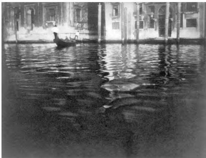
6 »Eine im Meer schwimmende Stadt« – Venedig. Fotografie von 1913.

nen, die Luisa Casati, Doris Castlerosse und Peggy Guggenheim dort verwirklichten. Es entbehrt nicht einer gewissen Ironie, dass dieser Palazzo, der ursprünglich eine patriarchale Dynastie verherrlichen sollte und mit ihr zerfiel, schließlich von drei unabhängigen, alleinstehenden Frauen vor dem Vergessen bewahrt wurde. Luisa machte ihn einschlägig bekannt, Doris machte ihn schick, und Peggy verwandelte ihn nicht nur in eines der bedeutendsten Museen der Welt, sondern auch in eines der beliebtesten und meistbesuchten Gebäude Venedigs.