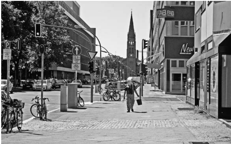
Die Genthiner Straße in Berlin Tiergarten, in der die Familie Gropius wohnte. Im Hintergrund die Zwölf-Apostel-Kirche.

lose Gegend einen schlechten Ruf hat, ist der Straßenstrich, der hier schon seit Jahren seinen Platz hat. 5 Die Lebensader des Stadtteils, die Potsdamer Straße, war einst der Inbegriff für Berlins Aufstieg zur Metropole und die damit verbundenen kulturellen Erschütterungen. Der Potsdamer Platz an ihrem nördlichen Ende, den Walter Gropius als junger Mann liebevoll »unseren Potsdamer Platz« 6 nannte, galt schon im späten Kaiserreich als ein Urbild der unbändigen Großstadt. Heutzutage eine Ansammlung präntiöser Hochhausarchitektur, fungierte er einst als Knotenpunkt der Moderne. Diese belebte Kreuzung mit ihrer polypenartigen Straßenführung war allerdings auch schon damals bekannt als florierendes Pflaster der Asphaltprostitution. Im entfesselten Verkehr der Menschen und Fahrzeuge schienen sich die Triebkräfte der neuen Metropole Bahn zu brechen. Die begehrten Frauen aus der Halbwelt fanden von hier aus sogar den Weg in die Bildwelt der modernen Malerei. 7