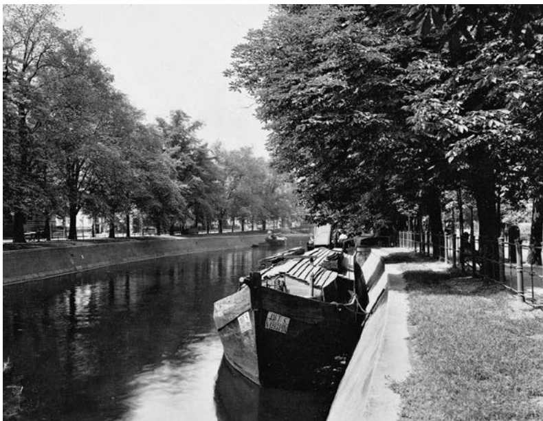
Der Landwehrkanal 1910. Seine Erweiterung gehörte zu den Erfahrungen seiner Kindheit.

Zu Hause waren sie vier Kinder, das ist für damalige Verhältnisse nicht viel. 14 In der damals noch seltenen Kleinfamilie hatten die Eltern mehr Zeit für jedes einzelne Kind. Die Intimität dieser Konstellation wurde noch dadurch verstärkt, dass zwei Geschwister bereits im jugendlichen Alter starben. Auf vertiefte Beziehungen deuten etwa die wechselnden Kosenamen hin: Walter wurde zu »Walty« oder »Walterchen«, Manon zu »Mannchen« und Georg zu »Orda« oder »Ordelchen«. Auch die Eltern verloren als »Muttchen« und »Väterchen« etwas von ihrer ansonsten so zeittypischen Autorität und Unnahbarkeit. Das innige Verhältnis untereinander drückte sich später in intensiven Briefwechseln aus, zwischen den Geschwistern, aber insbesondere auch zwischen Walter und seiner Mutter. Sie erfuhr wichtige Details seines Lebens in der Regel als Erste und nahm direkten Einfluss. Selbst als Walter schon erwachsen war, blieb ihr Rockzipfel auf diese Weise immer greifbar. Manon Gropius war lange Dreh- und Angel-